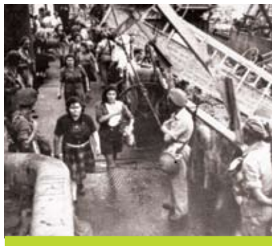
חיילים בריטים ומפעילים על סיפון אניית המפעילים "כנסת ישראל"