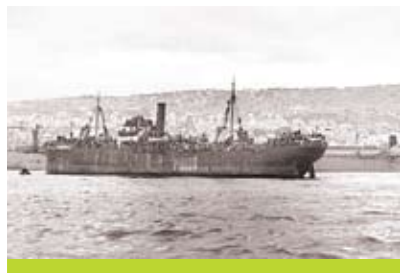
"כנסת ישראל" בקרבת נמל חיפה