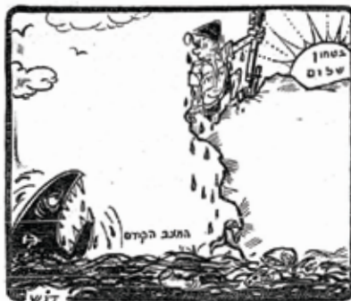
נכון אז, והיום עוד יותר. קריקטורה שפרסם המאייר דוש ז'ל כמה ימים לאחר מלחמת ששת הימים

ראוי להזכיר שבהתאם להסכמי אוסלו, להם ערב האיחוד האירופי, 98 אחוז מערביי יו"ש מנהלים שגרה אוטונומית באזורי A ו-B, כולל בתחום הבניה. לישראל הזכות והחובה לבנות עבור אזרחיה בשטחי C, בהם יש רוב יהודי מוחץ.