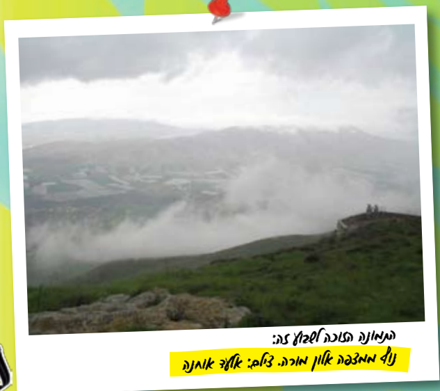
התמונה הוכנה לשלח זה: נולדו חמצניה אלון מזרחי