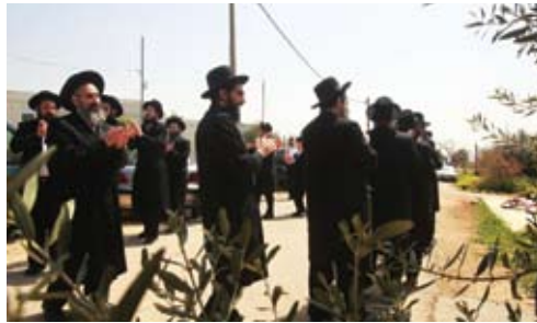
מגרון פורחת. תושבי תל ציון בברכת האילנות במגרון, השבוע

על אפס וחמתם של כל היריבים, מגרון יקום כיישוב קבע פורח בחבל בנימין, ויהיה אות ומופת עבור הדורות הבאים של מתיישבי ארץ ישראל. ▶