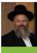
הרב שמואל אליהו