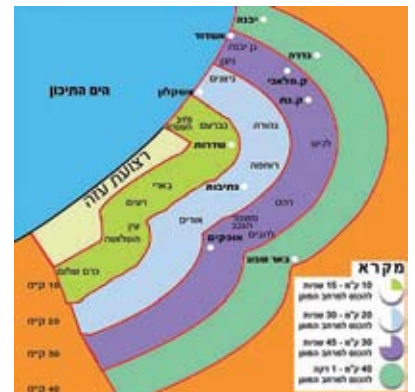
ערין רלוונטית? מפת טווחי הטילים של פיקוד העורף

במתקפה הנוכחית, נכון לשעת כתיבת שורות אלה, נותר טווח הטילים בעינו. אך בכירי מערכת הביטחון מבהירים כולם: הטווח עוד יגדל. המפה לא תישאר כשהייתה, וגם תל אביב תופיע בה.