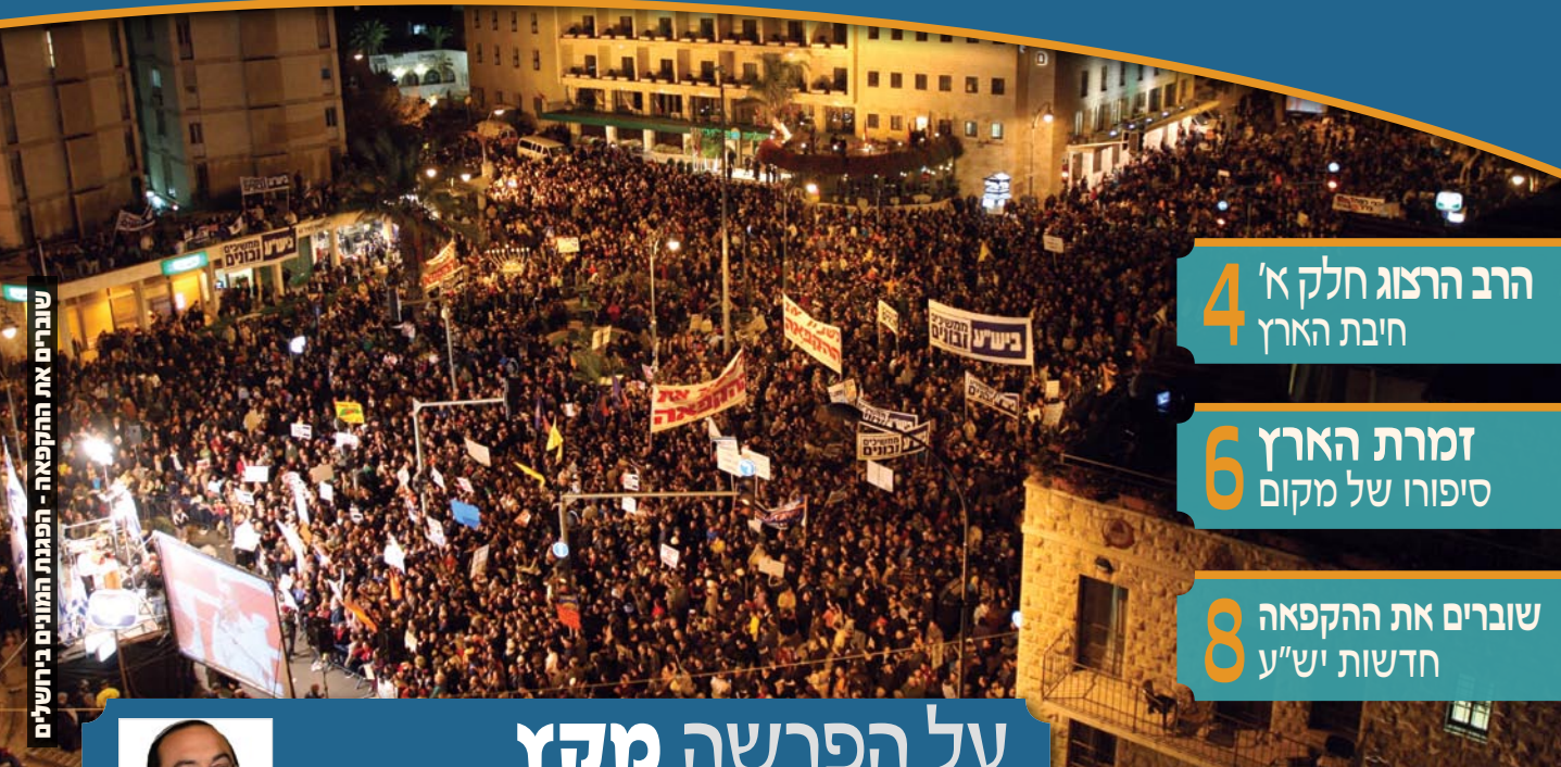
שוברים את ההקפאה - הפגנת המונים בירושלים

במה תורנית אידאולוגית ומעשית לחיזוק אחיזתנו בארץ גליון 176 | טבת תש"ע | 42 שנים לשחרור ירושלים יש"ע והגולן